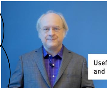
Usefulness, Utility and Usability